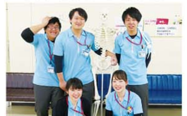
▲4月から入職した新人のみなさん