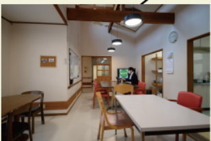
ふらっと立ち寄った地域の人とおしゃべりするくつろぎスペース