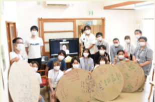
いとちかいぎでは、さまざまな人たちとお互いの考えを共有します