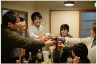
頑張ったご褒美に乾杯！切磋琢磨した同期が、一生ものの仲間に