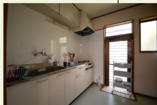
地域の食材を使ってみんなで調理。よい学びは健康的な食事から