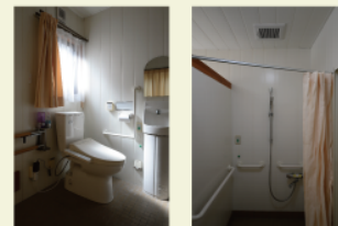
老人ホームの趣を残したままのトイレとお風呂。利用者の視点を学ぶ機会に