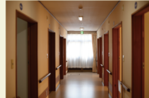
「医」と「地」をつなぐ拠点。ここでしか学べない地域医療があります