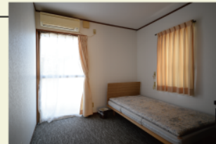
個室全8部屋にはエアコンとタンスが完備。ちょうどいい広さです