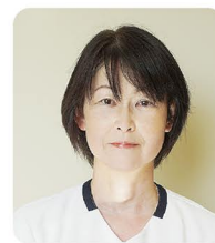
摂食・嚥下障害看護認定看護師