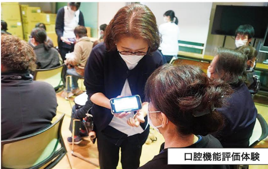
口腔機能評価体験