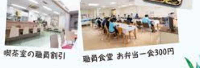
喫茶室の職員割引 職員食堂 お弁当一食300円